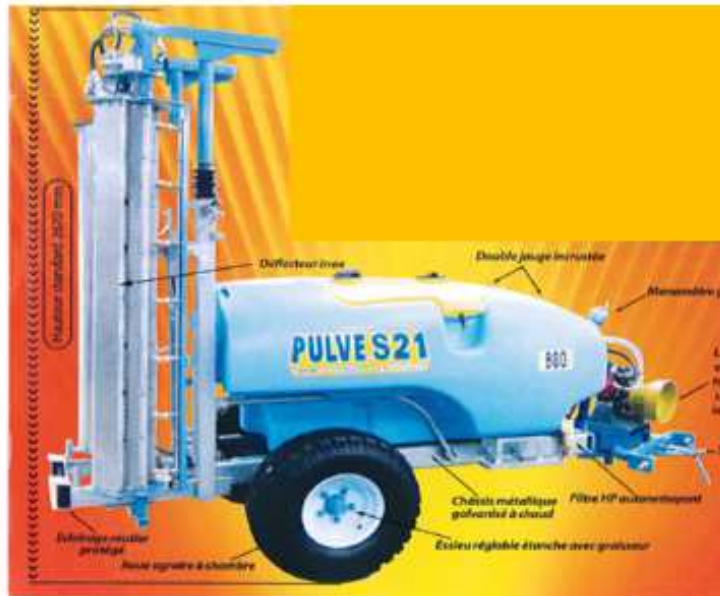
S21 – Rampe flux tangentiel

Moyens permettant de diminuer le risque de dérive de pulvérisation Aide à l'identification des matériels