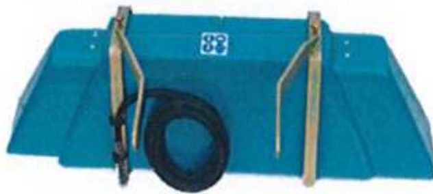
DHUGUES tunnel de désherbage