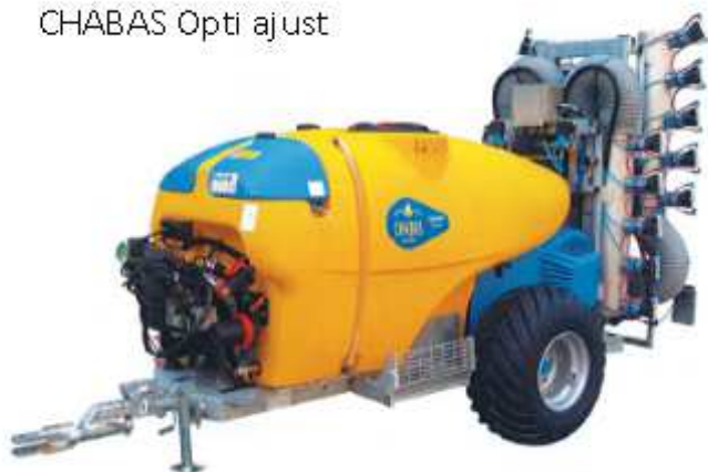
CHABAS Opti ajust