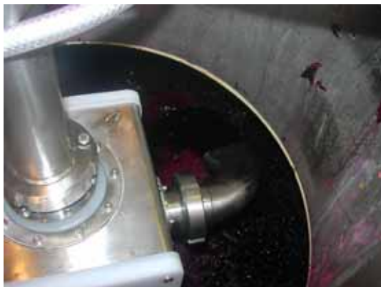
IFV Bordeaux-Blanquefort 2008

L'IFV a été sollicité pour étudier l'intérêt réel de la technologie de Thermo-détente sur l'extraction des polyphénols et la qualité des vins par rapport à une thermovinification classique.