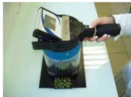
IFV Sud-ouest 2009