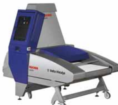
Bühcher Vaslin 2008