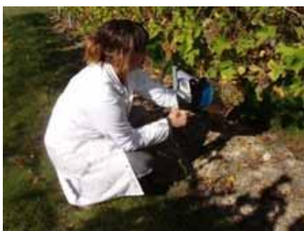
IFV Sud-ouest 2009

Un réseau de plus de 60 parcelles du Sud-ouest est conduit afin de mettre en relation l'information fournie par cette technologie et les caractéristiques analytiques des raisins à différentes stades phénologiques (de la fermeture de la grappe à la vendange). Parallèlement des essais métrologiques sont menés afin d'optimiser la prise d'information au champ.