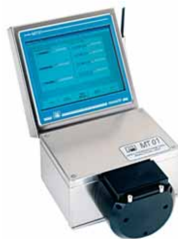
Maselli Mesure 2008

Lors des essais, sur toute la période de maturation, à partir des prélèvements de raisins réalisés sur les parcelles du réseau et destinés aux contrôles de maturité, des mesures hebdomadaires sont effectuées par cet équipement et sont comparées aux valeurs données par le laboratoire (teneurs et extractibilité des anthocyanes et maturité des pépins).