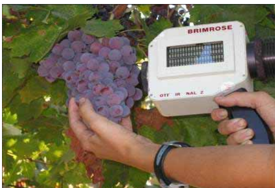
Chambre d'Agriculture Gironde 2009