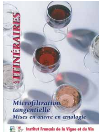
Photo 15 : Cahier Itinéraires de l'IFV sur la microfiltration tangentielle

Une synthèse des résultats a été réalisée et diffusée en 2009 dans le cahier itinéraire « Microfiltration tangentielle : mise en œuvre en œnologie ». Ce document aborde dans un premier temps les principes du procédé de microfiltration tangentielle, les matériaux des membranes adaptées à l'œnologie et les schémas de fonctionnement des circuits de filtration. Ensuite, au travers d'essais réalisés par l'IFV et ses partenaires, sont présentés les bonnes pratiques d'utilisation, les applications en œnologie et enfin les données économiques attribuées à l'utilisation de la microfiltration tangentielle.