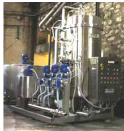
IFV Nîmes 2007