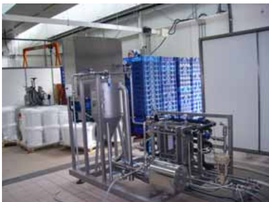
IFV Bordeaux-Blanquefort 2009

En 2007, une comparaison de ces techniques a été réalisée sur vins rouges en cours d'élevage et ces essais sont reconduits en 2008 et 2009. La filtration tangentielle et la flash-pasteurisation peuvent permettre de réduire significativement les populations de micro-organismes sur moûts et sur vin, en autorisant la réduction des doses de SO 2 . Efficacité et incidence sur la qualité des produits dépendent des matériels et des conditions d'utilisation. Des techniques innovantes, dites douces, basées sur des procédés athermiques, ont également été expérimentées en 2009 : stérilisation par UV, Champs Electriques Pulsés, courant d'électrolyse.