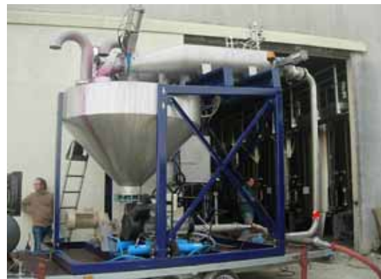
IFV Bordeaux-Blanquefort 2008