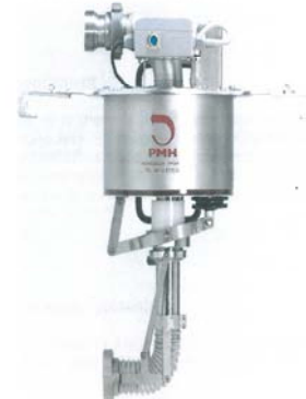
IFV Pôle Bordeaux Aquitaine 2009

Ces deux arroseurs mécaniques à commande électronique sont proposés pour permettre un arrosage homogène du chapeau de marc quel que soit le type, la forme et les dimensions des cuves. Ils sont programmables et mobiles mais peuvent également être utilisés en poste fixe.