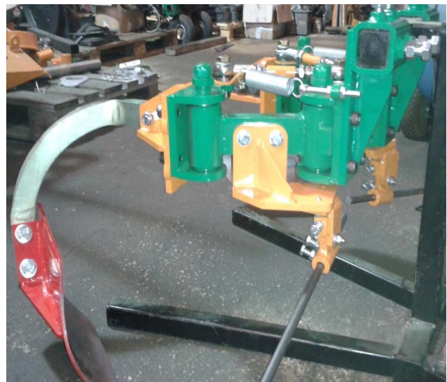
L. Pasdois CA33

La tendance actuelle est de proposer l'ajout d'accessoires sur un même système d'effacement. La société VITIMECA ne déroge pas à la règle, puisqu'elle a développé une bride fixée par 4 boulons (BTR de 14 mm) permettant le remplacement du col de cygne de l'élément décavaillonneur par une lame ou bien une tondeuse interceps.